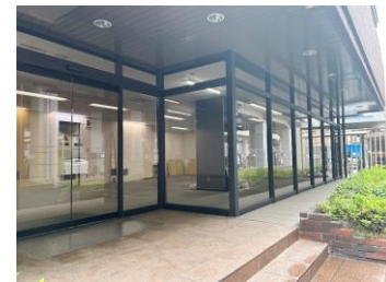
入口自動ドア、間口約11m、前面ガラス張り