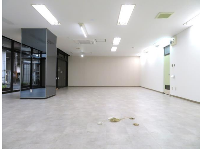
クロス、CF 新規交換済み

東武スカイツリーライン(東武伊勢崎線)新越谷駅歩10分 JR武蔵野線 南越谷駅歩10分