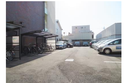
敷地内駐車場 2台空有