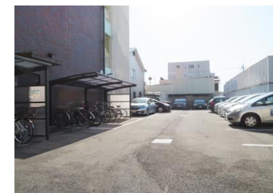
敷地内駐車場 2台空有