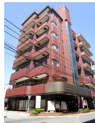
入口自動ドア、間口約11m、前面ガラス張り