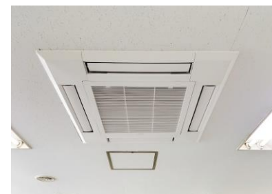
天井埋込型エアコン2台付 2023.5 設置