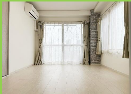
1DK 家電付賃貸マンション

複数路線利用可 ビックターミナル「大宮駅」歩約10分！ 都心への通勤・通学も大変便利！